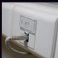
Installation électrique complète